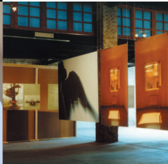
EOS EVENT - LA CASA DELL'ANGELO [MILANO]

El potencial de Metal Spot se completa con la posibilidad de desarrollar con la máxima flexibilidad productos modificados a partir de nuestros estándares o realizados completamente a medida, para afrontar las exigencias del sector Contract.