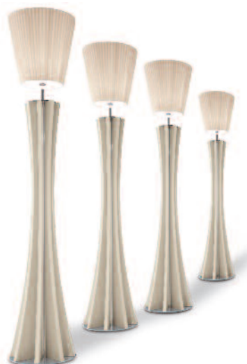
AD HOC SPECIAL PRODUCTION FOR SOMASCHINI MOBILI [CABIATE]

Ausführungen der Metallteile, Farbgebung der LEDs, Linsen und Veränderungen der Rahmengröße. Bei Anfragen nach Sonderartikeln, die zu den in diesem Katalog aufgeführten Produkten keine Beziehung haben, steht Ihnen unser technisches Büro für Analysen und Machbarkeitsstudien zur Verfügung. Unsere interne Planungsabteilung kann für Sie auf Anfrage Prototypen herstellen. Die hergestellten Sonderprodukte werden in unseren Labors getestet, um die gesetzlichen Bestimmungen zu erfüllen.