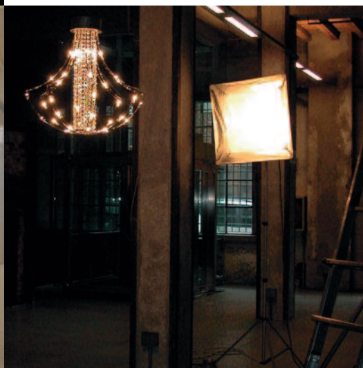
IMPERO SHOOTING - OFFICINE DEL VOLO [MILANO]