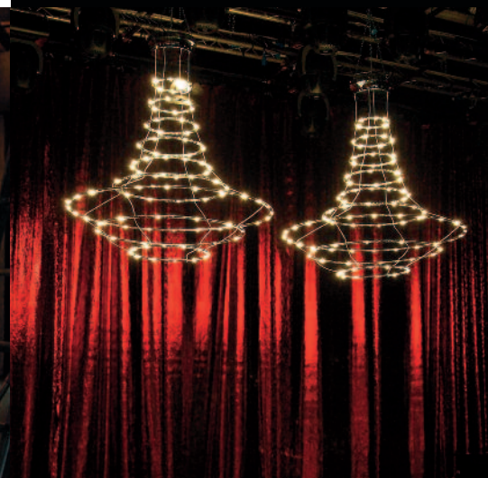
MUSE TV SHOW - MARKETTE [LA7 - ITALY]