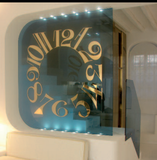
LED SHOWROOM FRANK MULLER [MYKONOS] PROJECT - CHERUBINI GROUP [ITALY]

При необходимости проектный отдел компании может реализовать прототипы. Изделия, изготовленные на заказ, испытываются в наших лабораториях в соответствии с действующим законодательством.